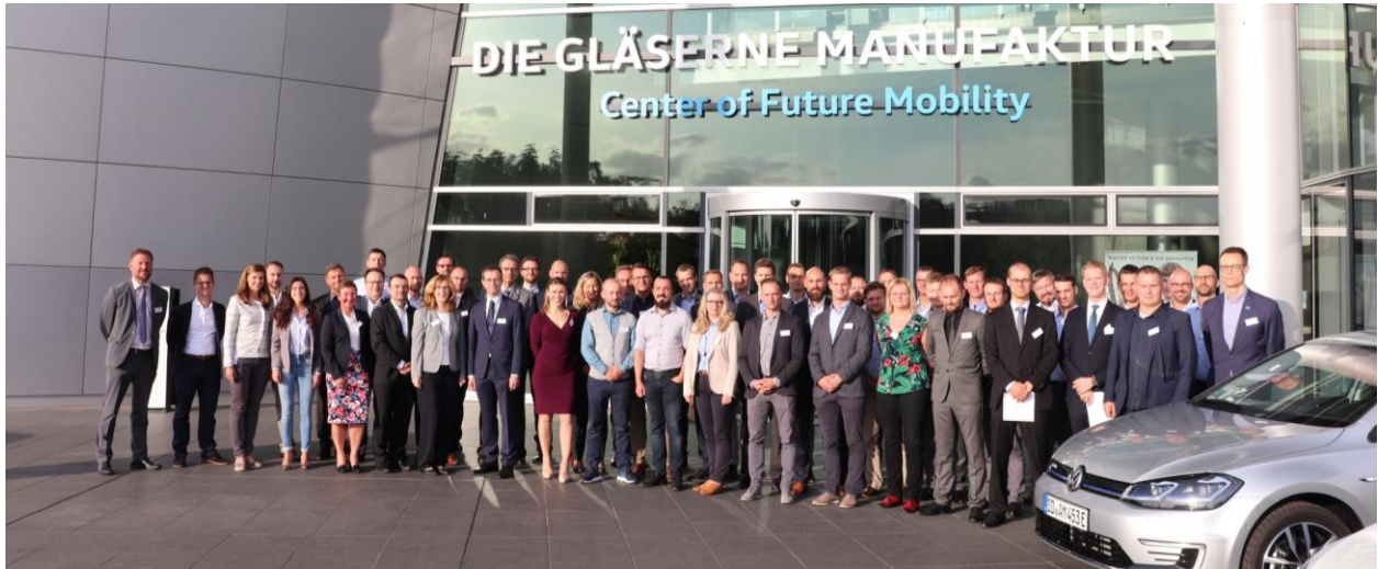
Impression 7. MFAO-Jahrestagung 2016