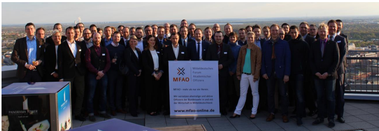
Impression 5. MFAO-Jahrestagung 2014